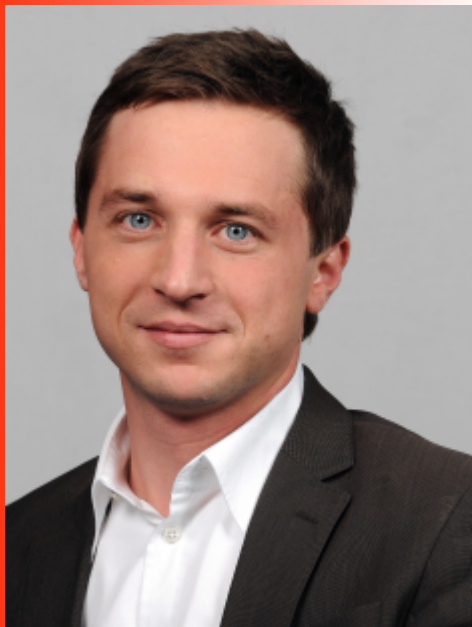
Sascha Binder MdL Präsident des Landesverbandes Pro Bürgerbus Baden-Württemberg