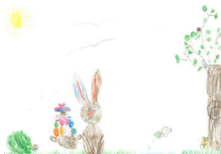
Bild vom Malwettbewerb

Eine Erfrischung ist im Teilnehmerbeitrag enthalten.