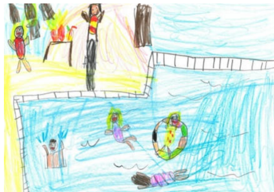
Bild vom Malwettbewerb

Bitte nicht im Dillingerweg parken. Nutzen Sie die Parkbuchten in der Breitenlauchstraße. Bezahlung erfolgt vor Ort.