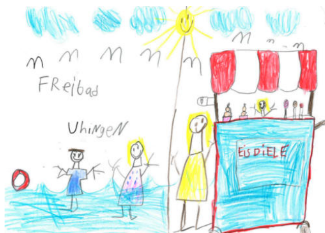
Bild vom Malwettbewerb