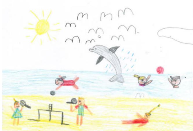
Bild vom Malwettbewerb