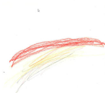
Bild vom Malwettbewerb

Taschenlampe, festes Schuhwerk (keine Sandalen), für abends eine warme Jacke