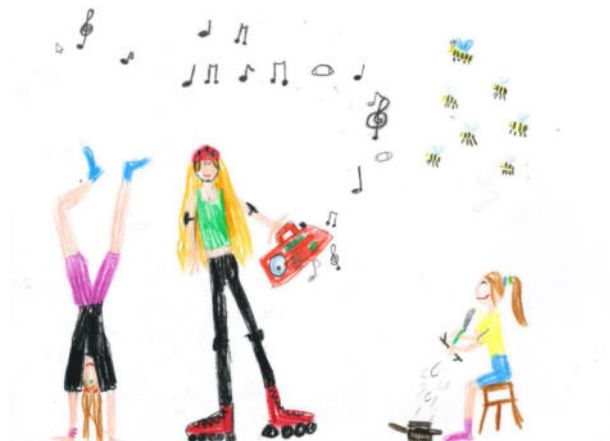
Bild vom Malwettbewerb

Hinweise, Mitzubringen, etc.: Bei Bedarf kleines Vesper und Getränk mitbringen. Bitte ein rotes T-Shirt oder Trikots anziehen.