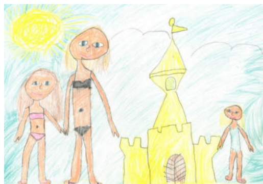
Bild vom Malwettbewerb

Bei langen Haaren ein Haargummi, gute Laune :-)