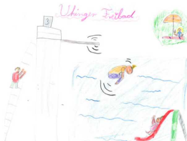
Bild vom Malwettbewerb

Turnschuhe, bequeme Kleidung, Getränk und kleines Vesper.