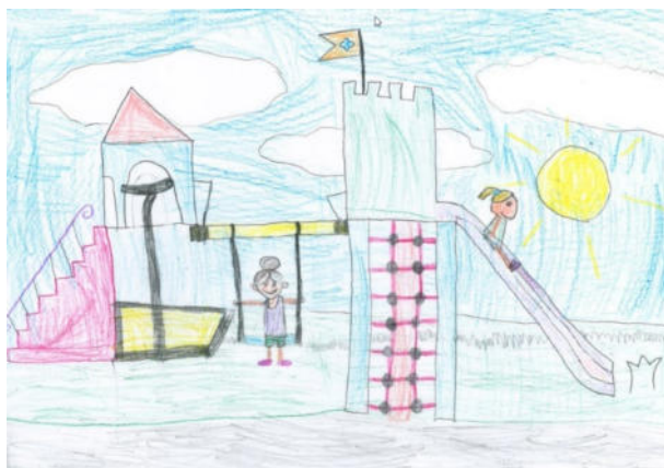
Bild vom Malwettbewerb

Turnschuhe, bequeme Kleidung, Getränke und kleines Vesper