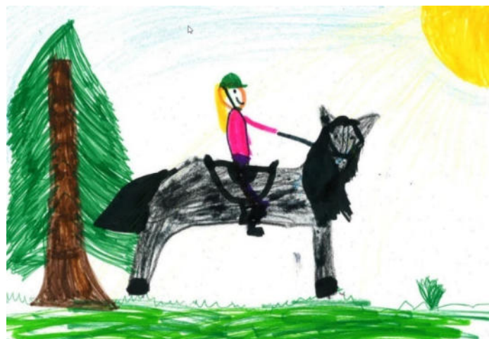
Bild vom Malwettbewerb