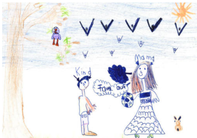
Bild vom Malwettbewerb