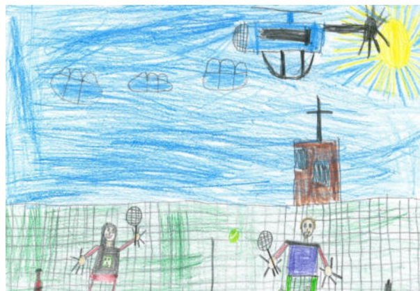
Bild vom Malwettbewerb

Festes Schuhwerk, wetterangepasste Kleidung. Für Essen und Getränke ist gesorgt.