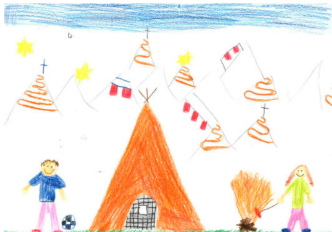
Bild vom Malwettbewerb