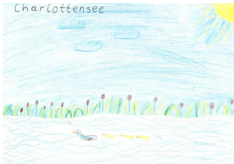
Bild vom Malwettbewerb