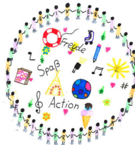
Bild vom Malwettbewerb

Bitte großes Handtuch mitbringen, bequeme Kleidung und etwas zu trinken.