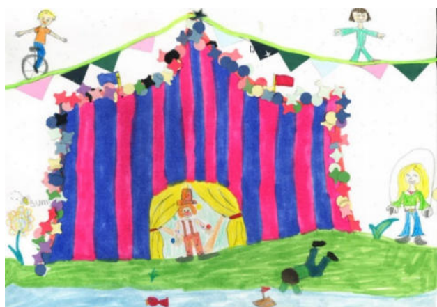
Bild vom Malwettbewerb

Sportkleidung, Turnschuhe und wer hat bringt gerne seinen Tennisschläger mit.